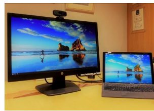
<テレワークスタイル>